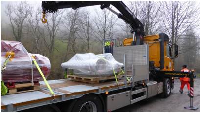
LKW Transport der Turbine