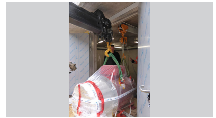
Genaueres und präzises Einbringen des Generators in das Reservoir