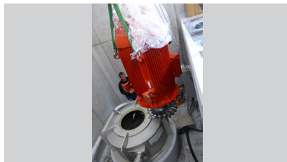
Positionierung des Generators