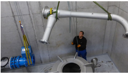
Einbringung des Einlaufkrümmers