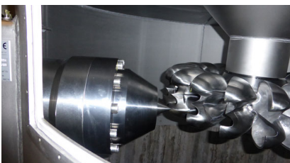
Sicht durch das Show-Fenster