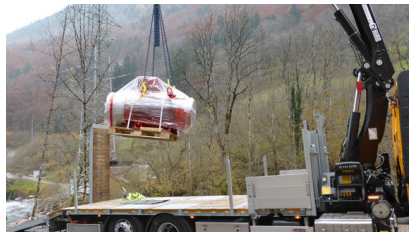
Ablad des 1.6 t schweren Generators