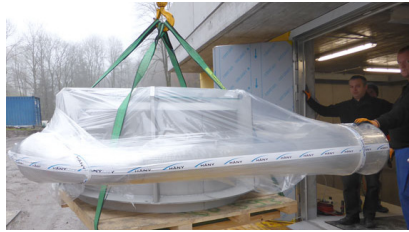
Ablad Turbinengehäuse und Einlaufkrümmer