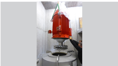
Vorbereitung zur Hochzeit Generator mit Turbinengehäuse