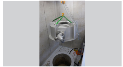
Positionierung des Turbinengehäuses