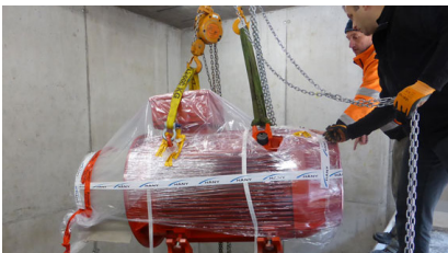
Ausrichtung zur Absenkung des Generators auf das Turbinengehäuse