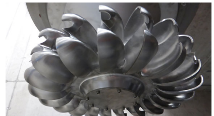
Peltonrad am Generator